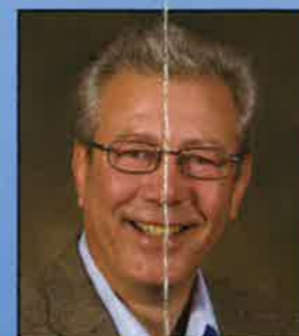
Stein Olav Aasland (Frp)