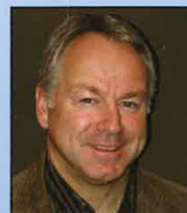
Erling Dahl (Frp) Leder hovedutvalget for infrastruktur